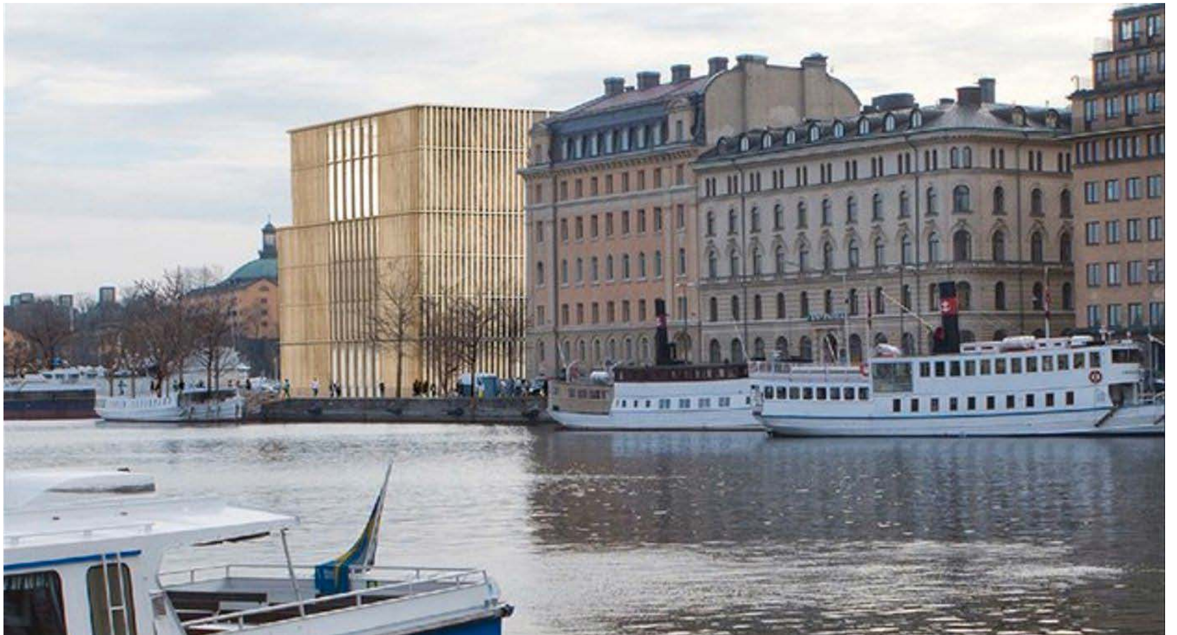
Bild: Illustration av Nobelcentret på Blasieholmen.