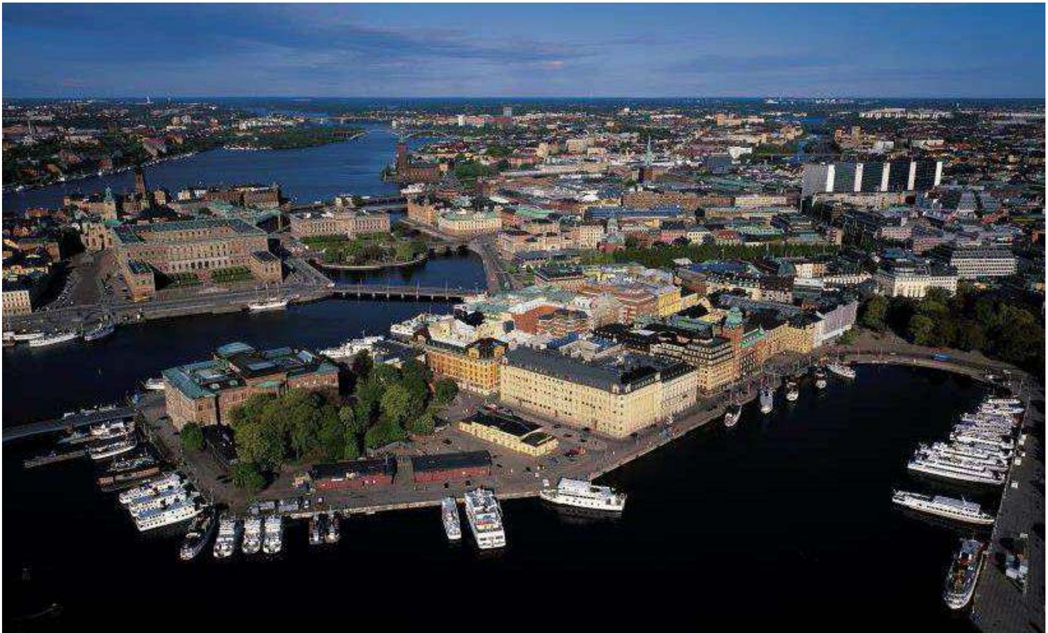
Bild: Flygfotografi över Blasieholmen där tullhuset och de två röda magasinsbyggnaderna syns i förgrunden (planbeskrivningen s. 17).